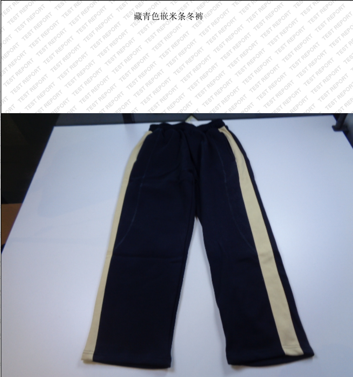
藏青色嵌米条冬裤